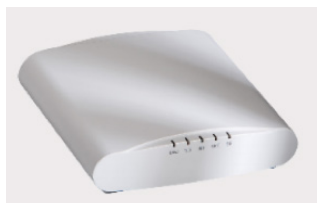
Borne Ruckus R510