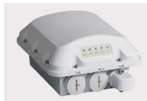
Borne Ruckus R310